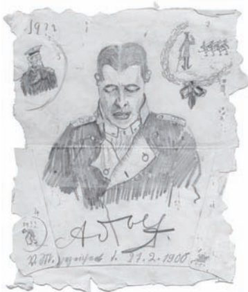
21 Wilhelm Leibl