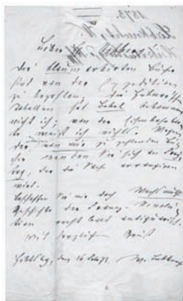
11 Wilhelm Liebknecht