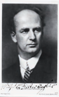
41 Wilhelm Furtwängler

les complètes à 120 francs en remises à l'homme au gendarme Dumas