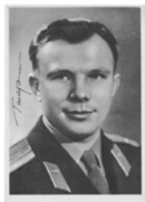
71 Juri Gagarin