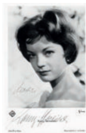
53 Romy Schneider