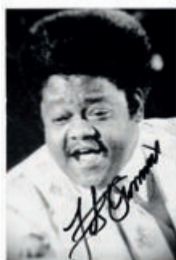
68 Fats Domino