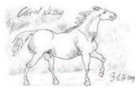
100 Curd Lessig