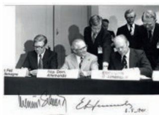
81 Erich Honecker