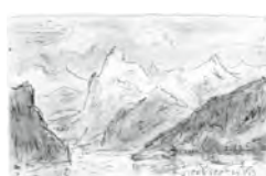
aus 56 Edwin Redlob