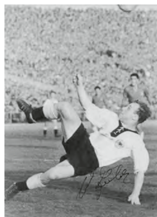
66 Uwe Seeler