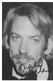
95 Donald Sutherland