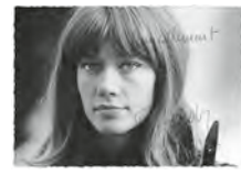
67 François Hardy